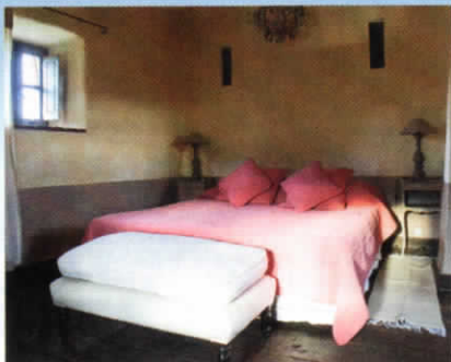
Finis le camping, les cavaliers veulent désormais un certain confort.

En revanche, pour ceux qui n'ont jamais mis le pied à l'étrier, ou très peu, la grande majorité des agences propose des formules plus sédentaires tout à fait adaptées qui permettent de