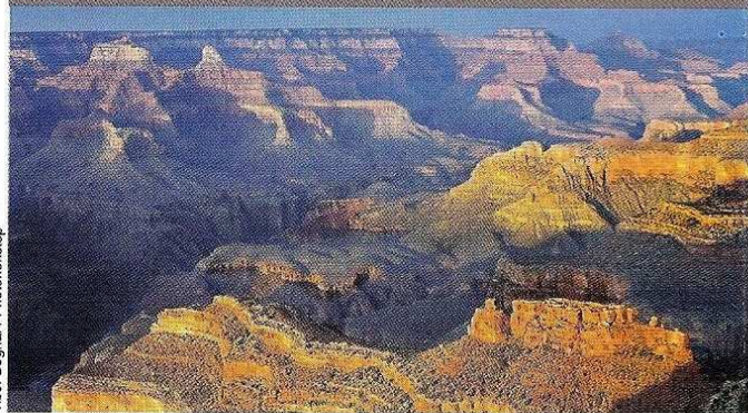
Tibor Bogner / Photonistcp